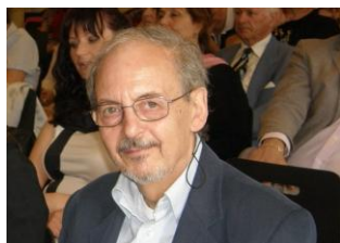
Carmelo Consoli poeta, presidente La Camerata dei Poeti di Firenze